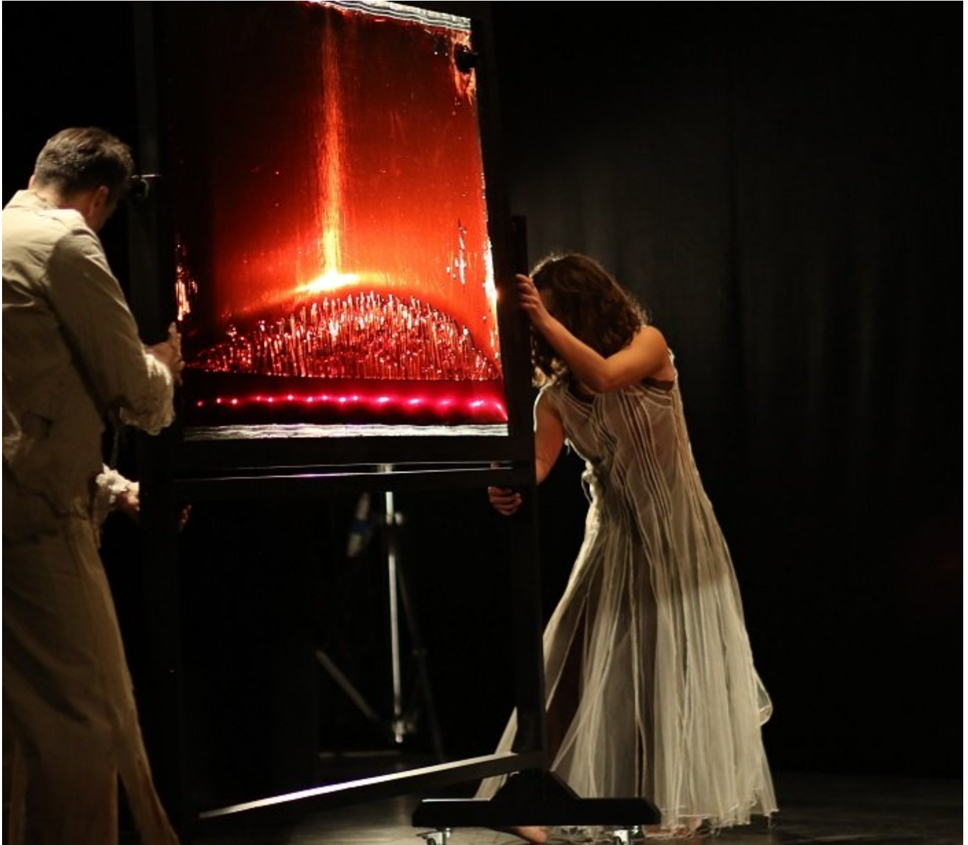
Opera Liquida. Noi guerra! Le meraviglie del nulla.

Il carcere più grande di Europa ha accolto i 350 spettatori attesi con un freddo pungente che ha accompagnato le lunghe procedure di accesso alla casa circondariale che prevedono tra le altre cose di lasciare in auto borse e cellulari. In piccoli gruppi dopo aver espletato le procedure Covid-19 e di riconoscimento con i nostri cartellini al collo siamo stati accompagnati dagli agenti penitenziari all'interno fino al teatro ricavato in un grande capannone. Seduti, ovviamente senza la possibilità di non potuto far altro che attingere al sistema utilizzato decenni prima che i social chiudessero ciascuno di noi nella propria bolla, il famoso metodo "parlate tra di voi".